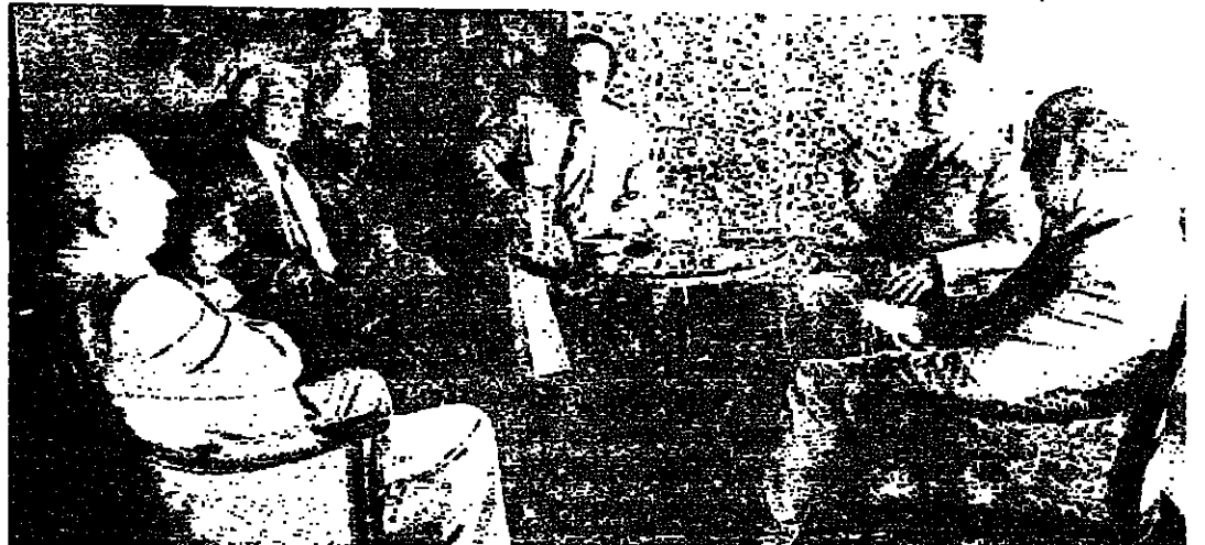
لقاء قبل الغداء في القلعة الرئيسة الإسعد وسلام والتواب كني والظاهر وسامره

منذ ما يقارب الستين لم يلتقيا ، فاعتبر لقاءهما أمراً بغيثاً يصلح سياسياً ، مع أن لا خلاف جوهري بينهما في النظرة إلى الإشعاع المحلي . بعد انتهاء جلسة مجلس النواب ظهر أمسي الذي الرئيسان كامل الإسعد وصائب سلام إلى مأدبة غداء في فندق فانوم حضرها النواب السادة : جبيل كني ، مخايل الصاهر ورافق سامره .